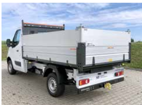
Umbausatz zum Hinterkipper mit seitlicher Bordwanderhöhung