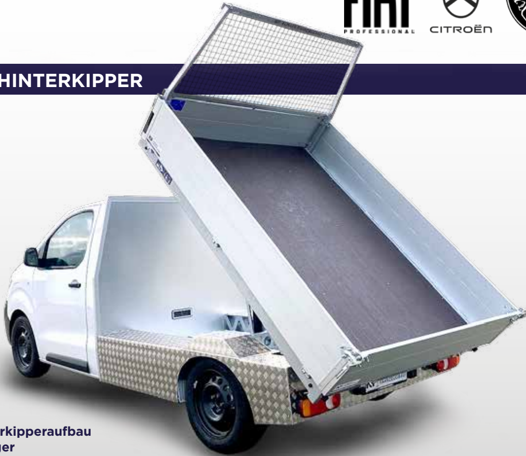
EKO mit Hinterkipperaufbau und Leiterträger