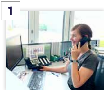
Beratung und Auftrag