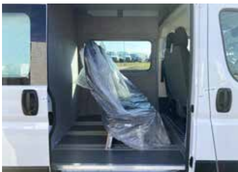
Trennwand hinter der zweiten Sitzreihe