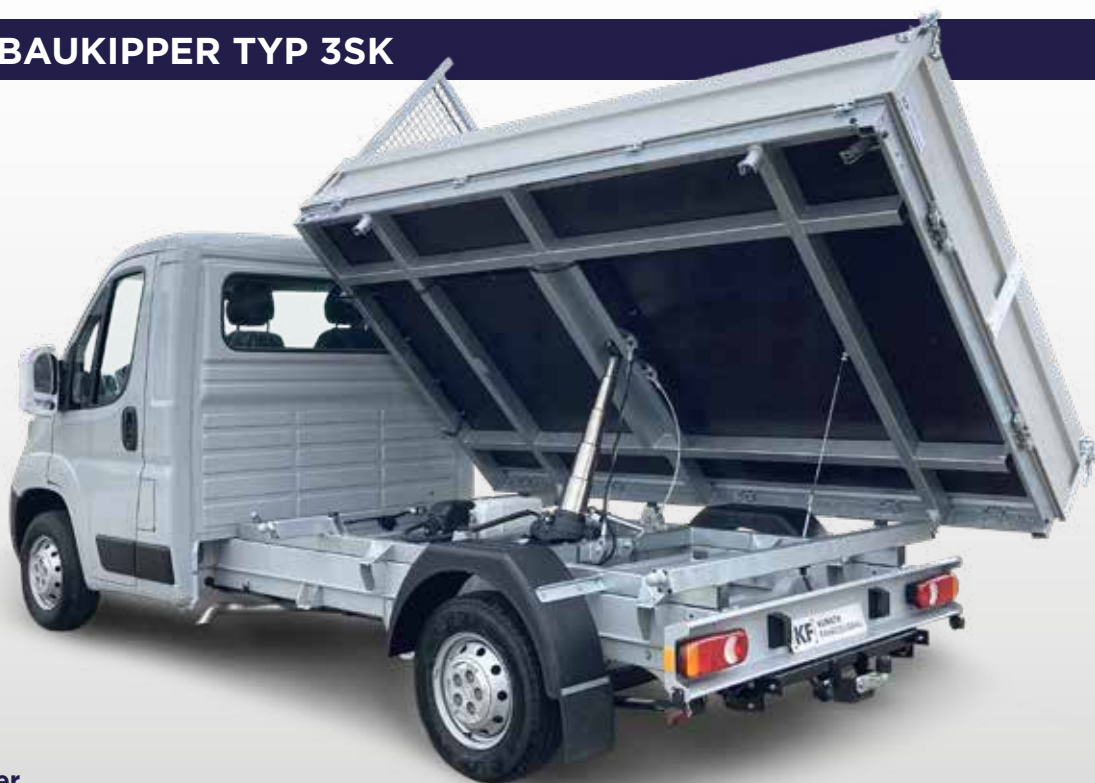
X250 mit Dreiseitenkipper