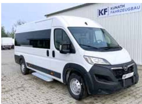
Fensterausschnitte & seitliche Trittstufe