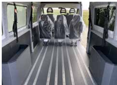
AMF-Bruns 2 Punkt Automatik Schrägschultergurt