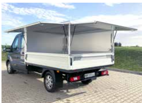
Kofferaufbau mit Klappen