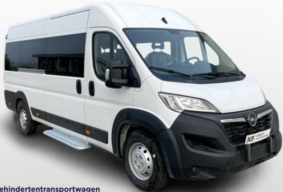
X250 umgerüstet zum Behindertentransportwagen