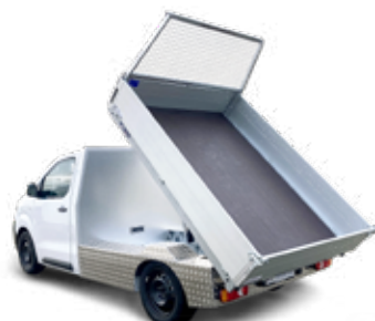
9 Auslieferung des fertigen Fahrzeuges