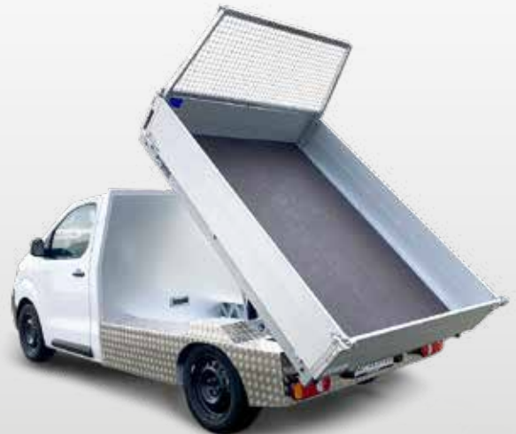
Fahrzeug nach Umbau