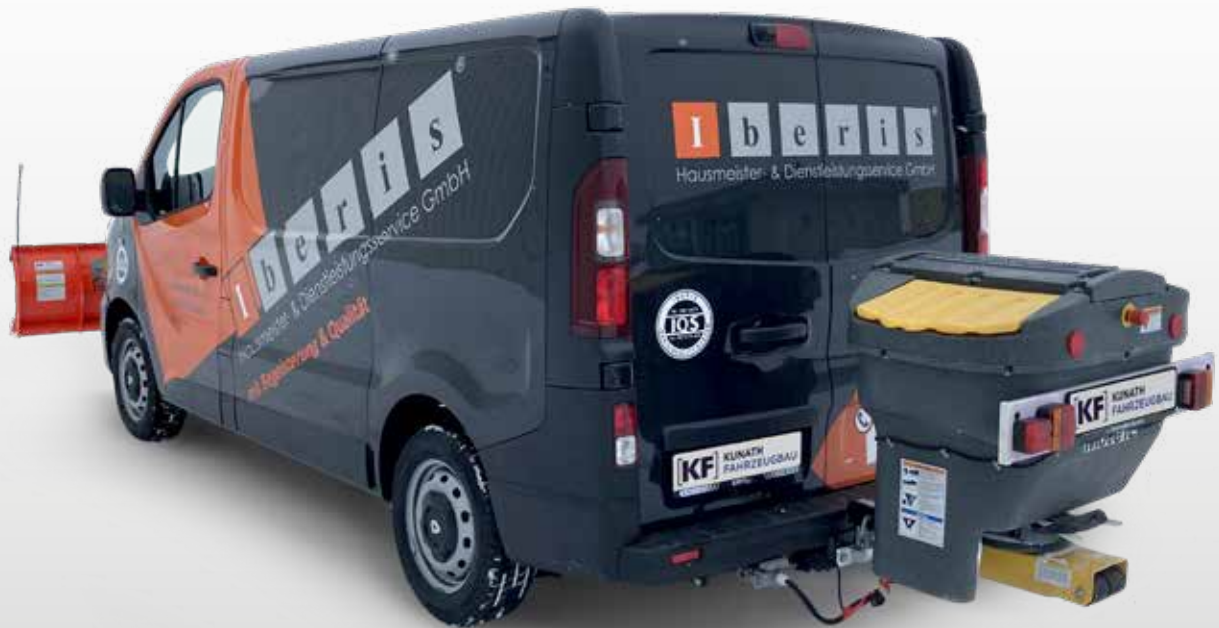
X250 mit Winterdiensttechnik