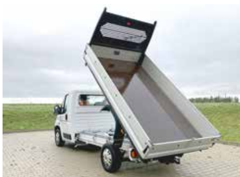
Umbausatz zum Hinterkipper mit seitlicher Bordwanderhöhung