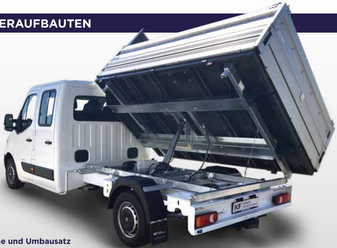
X250 mit Werkspritsche und Umbausatz zum Dreiseitenkipper