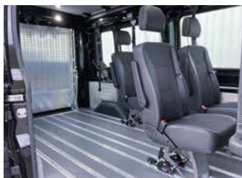
AMF-Bruns Smartfloor inkl. Sitze