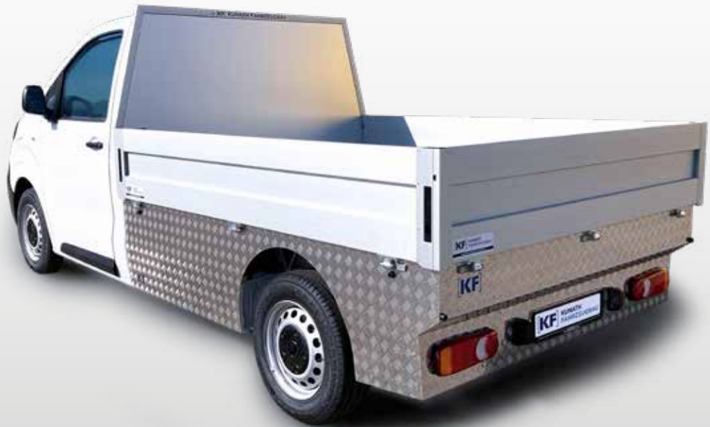
EKO mit Pritschenaufbau