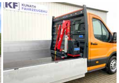
Kran auf der Werkspritsche