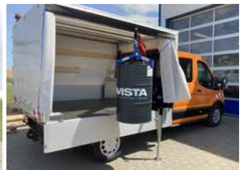
Pritsche mit speziellem Ladekran