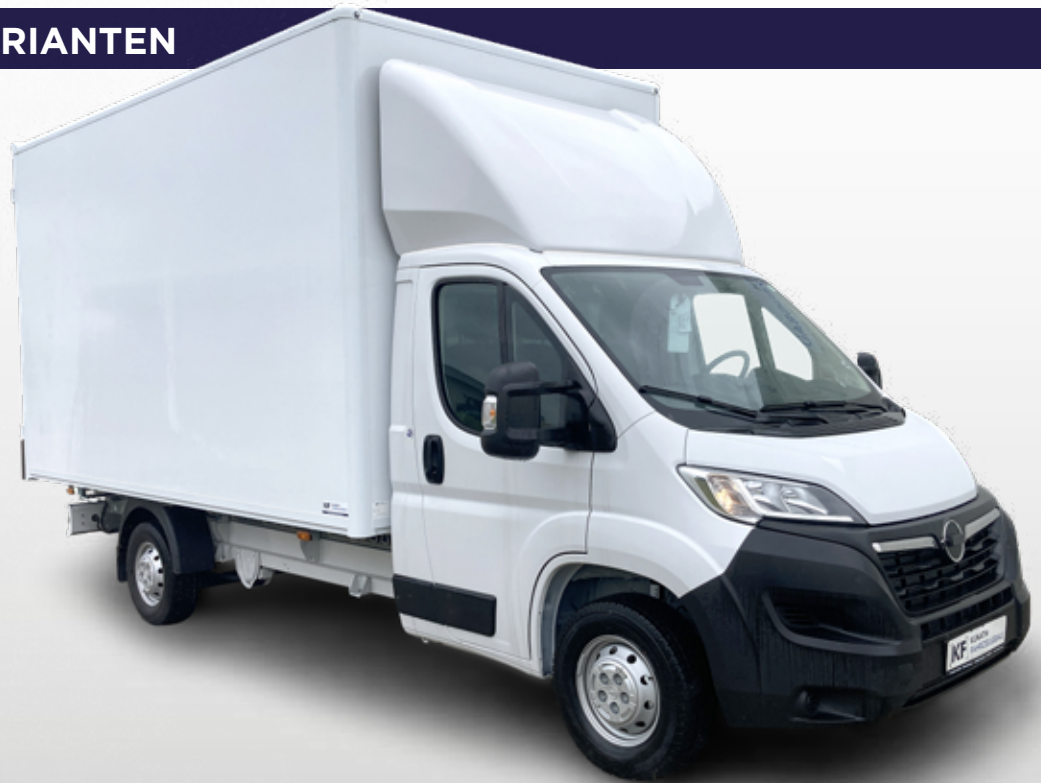
X250 mit Kofferaufbau