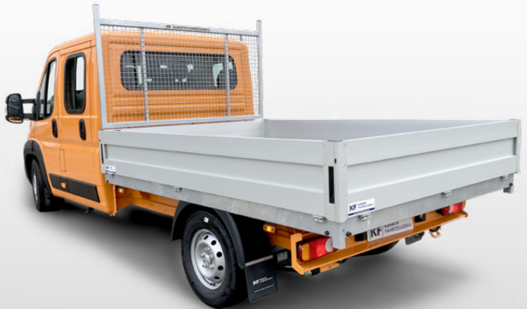
X250 mit Pritsche und Leiterträger